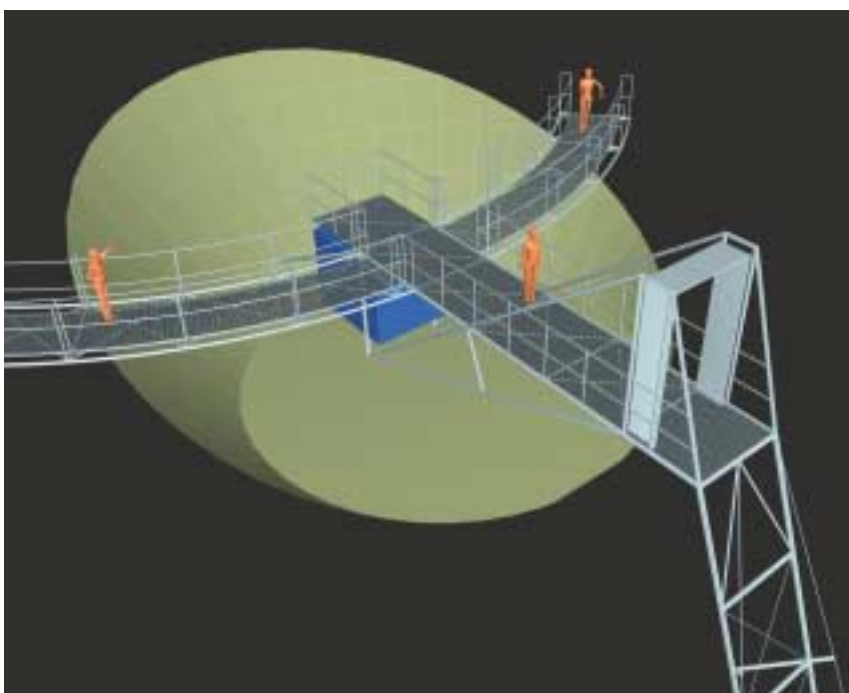
Horní stanice výtahu - schema