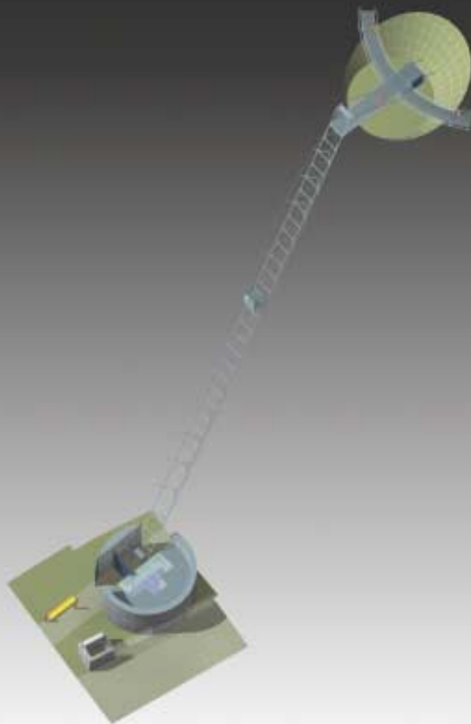
Celkové schema výťahu

Původní tzv. rychlovýťah byl vybudován v letech 1979 - 1980, jako spojovací a nástupní komunikace z Labského nábřeží na skalní terasu Pastýřské stěny. Byla volena konstrukční kombinovaná varianta, kde část přístupové komunikace byla vedena 55 m dlouhým tunelem raženým ve spádu do paty skalní stěny a z podzemního nástupiště byl v šachtě kolmo vedený prakticky typový výťah, který překonával výšku cca 58 m. Tento výťah sloužil do 90tých let, kdy byl jeho provoz ukončen.