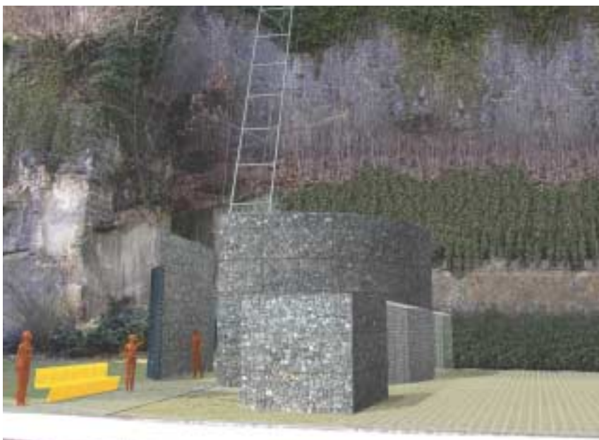
Spodní část výtahu - zákres