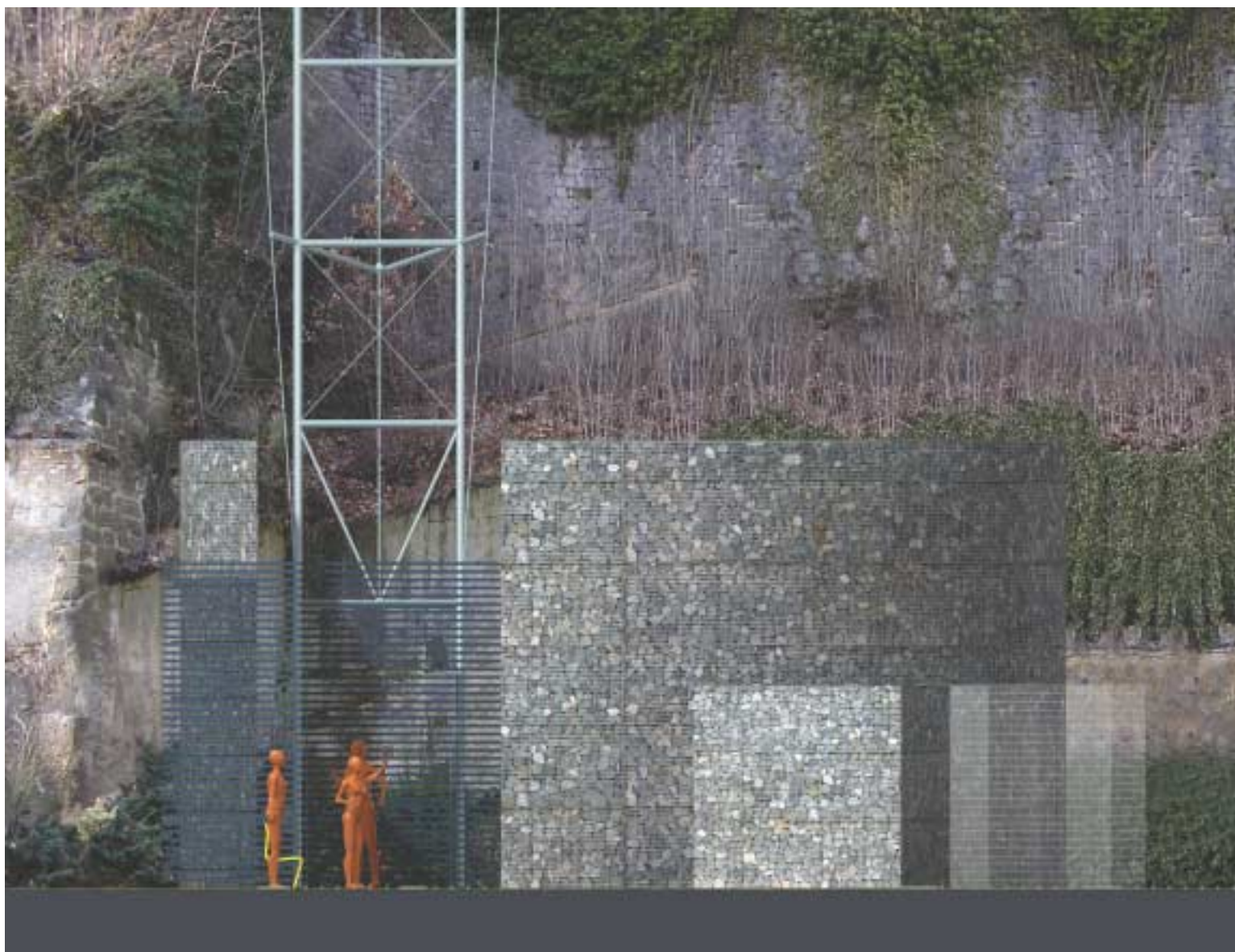
Spodní stanice výtahu - zákres

Výsledná navrhovaná varianta, která je nyní ve stadiu projednávání územního rozhodnutí vznikla po provedení komplexních geodetických a geologických průzkumů a za přísného dohledu CHKO Labské pískovce. Stěna byla geodeticky naskenovaná, aby bylo možno provést variantní vislé řezy terénem pro zvolenou trasu výtahu. Trasa byla vybrána ve spolupráci s experty na stabilitu skalní stěny, která je průběžně monitorována. Ve výsledné variantě je panoramatický výtah volně veden po šikmém nosníku pod úhlem 70^\circ , který odpovídá sklonu skalní stěny. Nástupní stanice je na úrovni stávajícího vstupního objektu původního přístupového schodiště na kótě 131 m.n.m. V horní poloze vrcholové stanice je přístupová distanční lávka, která překonává horizontální vzdálenost cca 10 m - rozdíl mezi nástupním místem a horní výstupní plošinou na kótě 207.m.n.m. Vlastní těleso šikmé nosné konstrukce je subtilní průhledná ocelová konstrukce, která plně využívá současných možností předpínání ocelových konstrukcí. Vlastní ocelová konstrukce výtahového tělesa sestává ze dvou nosníků, které