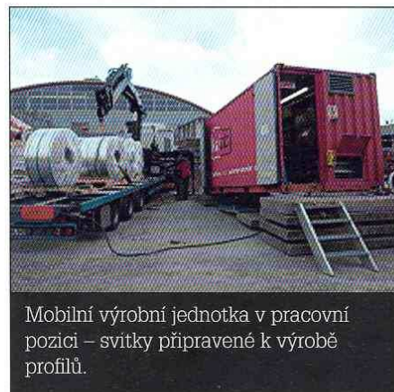
Mobilní výrobní jednotka v pracovní pozici – svitky připravené k výrobě profilů.

Jak dodal, Kalzip, který je schopen vyrobit na stavbě třeba i 150 m dlouhé profily v jednom kuse spolu s kotvením, skrytým pod střešním pláštěm, a možností ošetření prostupů střechem svařováním, si pak může