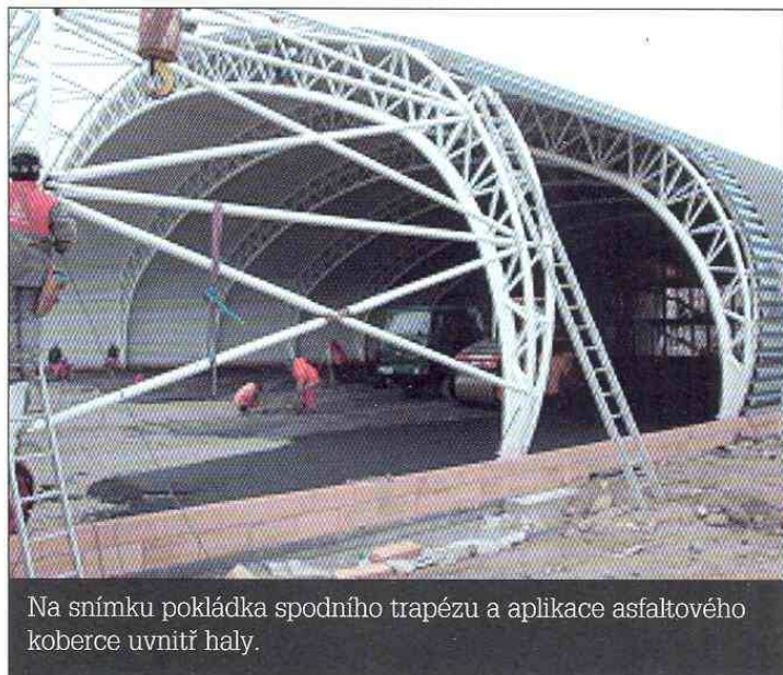
Na snímku pokládka spodního trapézu a aplikace asfaltového koberce uvnitř haly.

Ocelová konstrukce zastřešení má půdorysný rozměr 38 × 62 m. Světlá výška haly ve vrcholu je 9,3 m. Nosnou konstrukci tvoří deset obloukových příhradových vazníků v modulu 6,1 m a rozpětí 38 m s patkou propojenou táhlem. Uprostřed má oblouk poloměr 36,5 m a v krajích 4,89 m. „Celkově se tedy tvar konstrukce jeví jako eliptický. Příhradový vazník je trojbokého průřezu, který se směrem k patce zmenšuje,“ říká. Dolní pás a horní pásy jsou tvořeny trubkami z materiálu S355. Diagonály a svislice jsou také trubkového