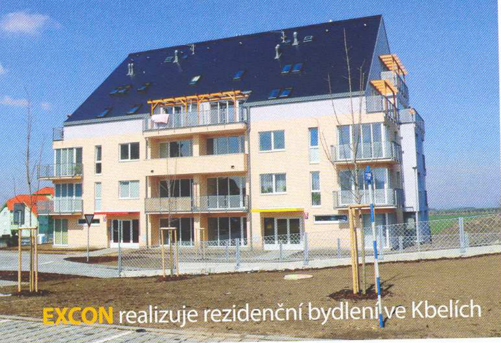
EXCON realizuje rezidenční bydlení ve Kbelích