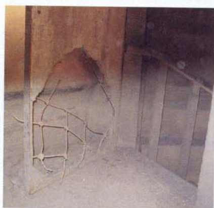
Torzo železobetonových dveří s nýťovanou výztuží