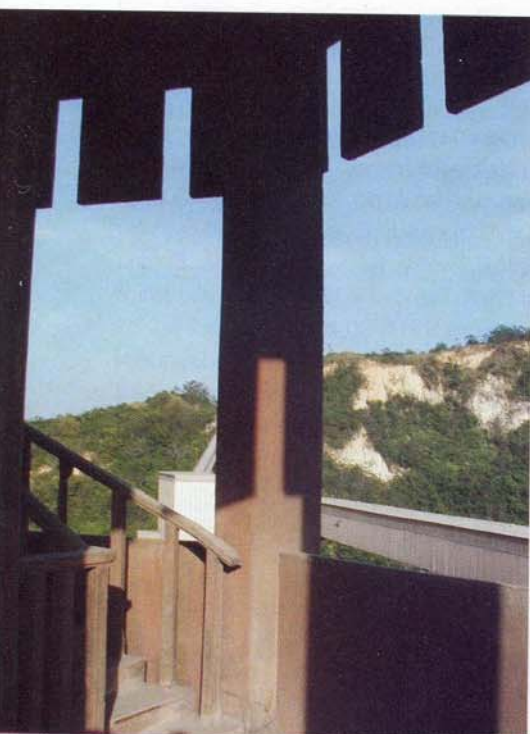
Detail schodiště a "krajkové" pláště pod nádrží