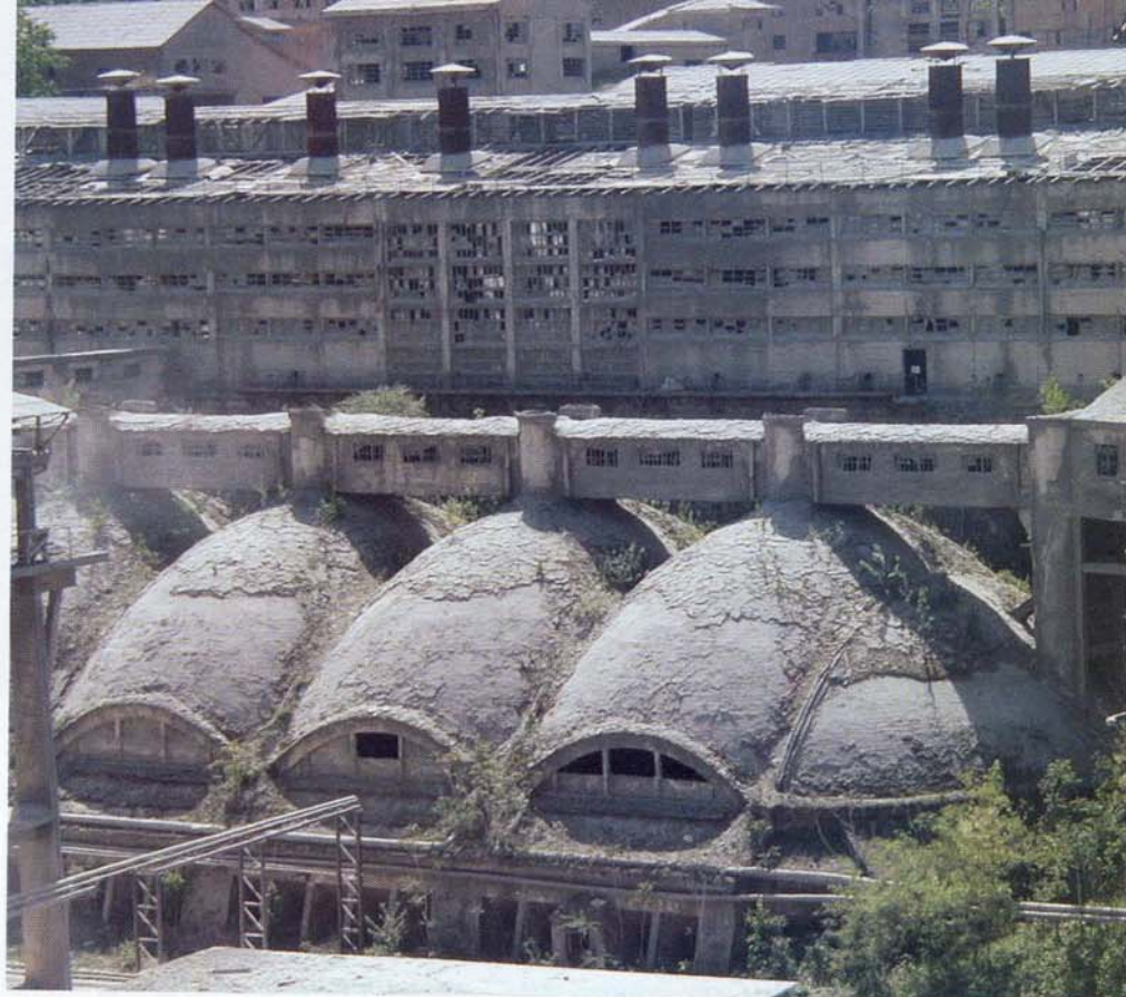
Skořepinové zastřešení bunkrů

vstupních dveří (bohužel dnes již poničených s chybějícím dveřním kováním). Ze železového betonu je i nástavba pro hromosvod na střeše a "krajkové" ozdoby fasády pod nádrží. Ačkoliv jsme se snažili získat i technickou dokumentaci této unikátní stavby, nebyli jsme úspěšní (dle pracovníků cementárny již neexistuje). Neznáme proto bohužel bližší technické podrobnosti, i tak však považujeme stavbu za natolik zajímavou, že o její výjimečnosti hovoří fotografie jak celku, tak i detailů vodojemu.