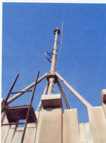
Nástavba pro hromosvod

Ing. Jaroslav Vácha, EXCON, a. s. Ing. Jaroslav Celý, Přerovské strojírný, a. s.