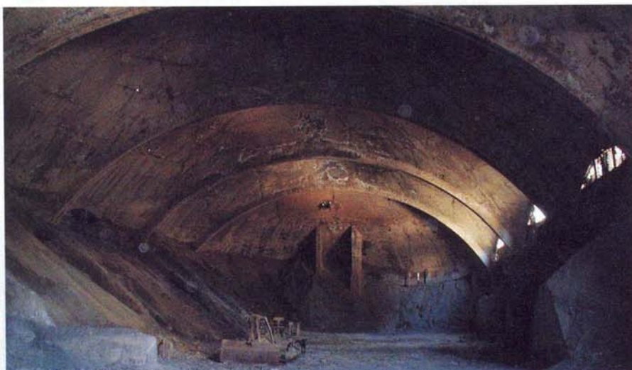
Vnitřní pohled na skořepinové zastřešení

As part of the preparations for reconstruction of the furnace line in the Beočin Cement Plant (not far from Nový Sad in northern Serbia) we visited the plant itself. Our task was to acquire as detailed as possible information about the real state of the buildings destined for reconstruction directly on site and obtain detailed technical documentation. We carried out a thorough tour and inspection of the entire cement plant complex.