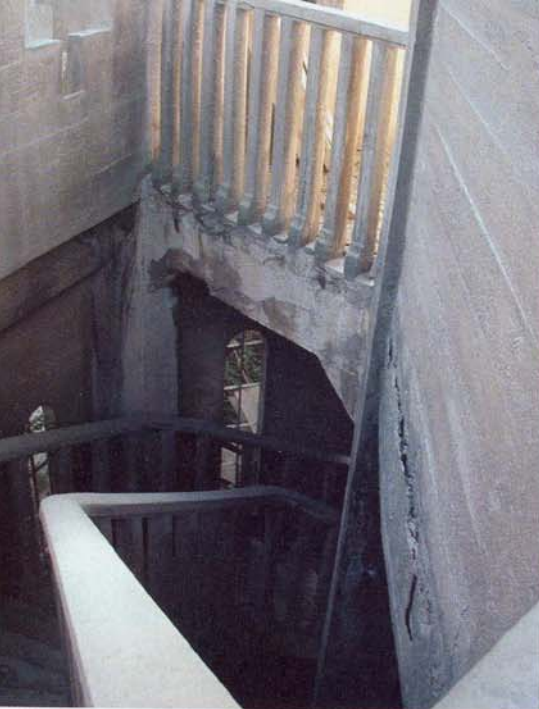
Detail zábradlí schodiště