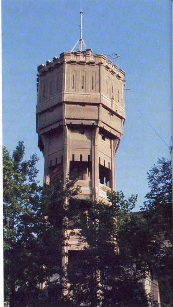
Celkový pohled na vodojem

Při procházení jednotlivými provozovanými objekty jsme zjistili zajímavý způsob výstavby a rozšiřování závodu. Údolí Dunaje (především jeho pravý břeh, který je zde vyšší) je v oblasti kolem Nového Sadu tvořen jednotlivými terasami. Cementárna byla založena již v první polovině 19. století, a to na nejvyšší z teras na pravém břehu Dunaje těsně před samotným městem Beočin. Tak, jak se výroba postupně modernizovala a rozšiřovala, stavěly se nové provozy vždy postupně na nižší terase. Vyšší terasa se opustila a ze zrušených objektů se většinou pouze demontovala technologie a ocelové nosné konstrukce (šrot). Stavební konstrukce (od konce 19. století již železobetonové) se ponechaly bez užitku postupnému chátrání. Při prohlídce areálu jsme našli dokonce zbytky šachtových pecí