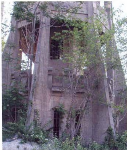
Spodní podlaží vodojemu

Při procházení jednotlivými provozovanými objekty jsme zjistili zajímavý způsob výstavby a rozšiřování závodu. Údolí Dunaje (především jeho pravý břeh, který je zde vyšší) je v oblasti kolem Nového Sadu tvořen jednotlivými terasami. Cementárna byla založena již v první polovině 19. století, a to na nejvyšší z teras na pravém břehu Dunaje těsně před samotným městem Beočin. Tak, jak se výroba postupně modernizovala a rozšiřovala, stavěly se nové provozy vždy postupně na nižší terase. Vyšší terasa se opustila a ze zrušených objektů se většinou pouze demontovala technologie a ocelové nosné konstrukce (šrot). Stavební konstrukce (od konce 19. století již železobetonové) se ponechaly bez užitku postupnému chátrání. Při prohlídce areálu jsme našli dokonce zbytky šachtových pecí