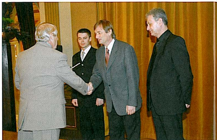
▲ Předávání CENY ČKAIT 2008 na Shromáždění delegátů ČKAIT

Firma: Stráský, Hustý a partneři s.r.o. (SHP), Bohunická 50, 619 00, Brno