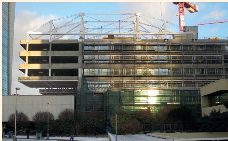
Trimaran – návrh předpjaté ocelové superkonstrukce

M. L.: Cílem naší automatizované výroby jsou přesně opracované položky, tedy profily a plechy připravené pro další zpracování ve výrobním procesu. Náš automat na přípravu tyčových prvků nařeže položky na požadované délky, vyvrtá či vyfrézuje otvory, vytvoří řezané závitky nebo zahloubené