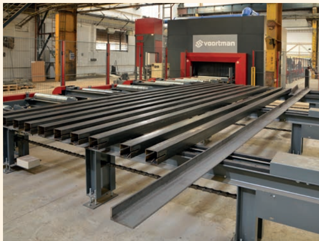
Excon spouští ve výrobě v Teplicích dvě nové automatické linky