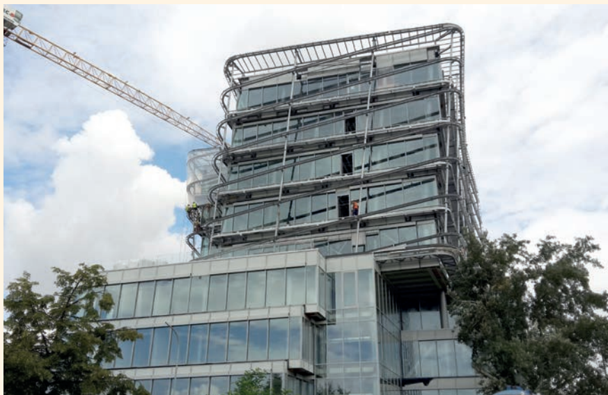
ČVUT v Praze – Český institut informatiky, robotiky a kybernetiky – budova A

K. Č.: Zatím máme prvního robota. V současné době probíhá anketa mezi zaměstnanci a vybíráme mu jméno. Do budoucna bude automatizace pokračovat v oblasti měření. Další roboti budou pravděpodobně kolaborativní a budou v procesu nasazení na opakované činnosti, které se dají naprogramovat. Je tu velký prostor pro realizaci nejrůznějších nápadů.