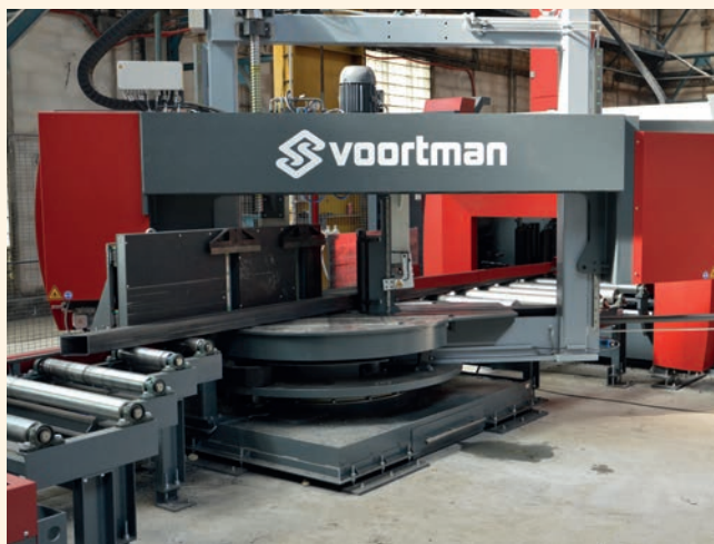
Pohled na pilovrtací centrum

modelem vytvořeným v úvodu procesu projektantem. Až takhle jednoduché, kvalitní a rychlé to může být, když je to pod jednou střechou.