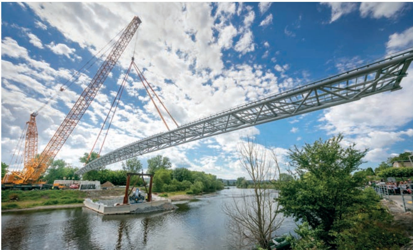
Uložení lávky jeřábem.

odnímatelná kompozitní mostovka s protiskluzovou úpravou. Mostovka je uložena příčně asymetricky s přesahem cca 0,4 m od osy horního pasu nosné konstrukce na návodní straně ve sklonu cca 1,6 %. Zábradlí výšky 1 300 mm je opatřeno madlem ve výšce 1 m. Výplň tvoří nerezová síť.