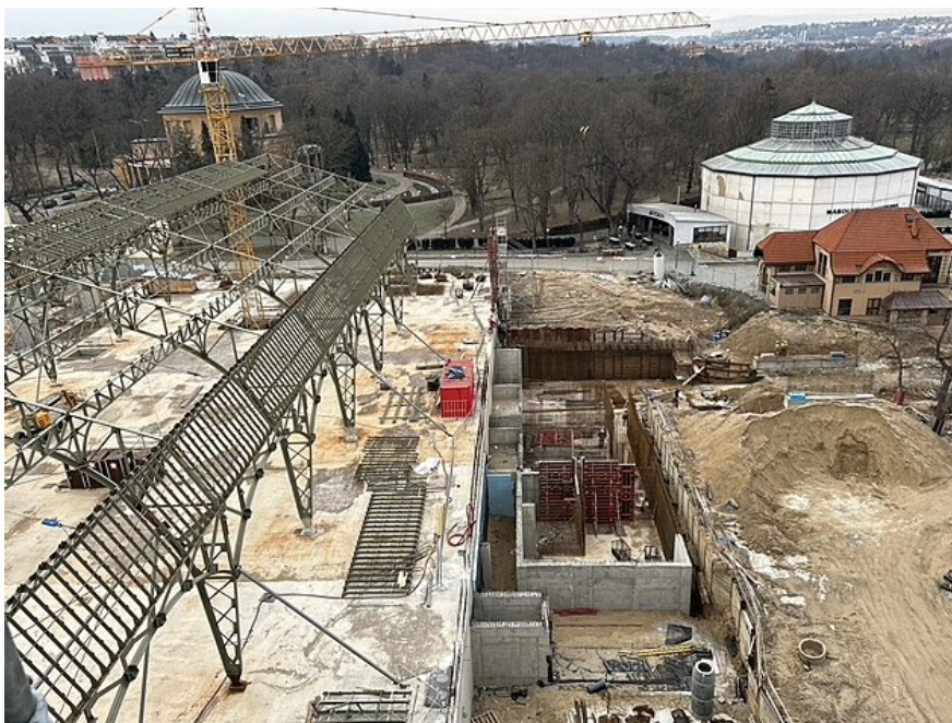
Jsme na střeše Průmyslového paláce.

„Klid, tohle vydrží!“ směje se v ledovém větru Čech při cestě vzhůru ve vzrjící a klepající se zdviži. Pomalu se zjevuje Trojský most, sídliště na severních krajích města, část parku Stromovka. Dělníci, stroje a budovy areálu Výstaviště, kde palác stojí, se vzdalují. Ten výhled! Samozřejmě, seshora všechno vypadá jinak, než když se díváte na palác ze země. Procházíme po lešení, které se tak zvláště vlní, musíte překonat schod v rohu a mírně se přitom sehnout pod trubkou lešení. Až se z toho točí hlava.