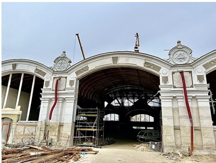
Stavba levého křídla spustila celkovou rekonstrukci Průmyslového paláce.

V teplotách jako na horách mluvíme také o problematice nýtovaných staveb. Právě Průmyslový palác byl touto technologií postaven. Stejně jako Petřínská rozhledna nebo železniční most pod Vyšehradem, o kterém se v Praze hodně diskutuje. Je totiž v plánu most zbourat a postavit nový, což má své odpůrce i podporovatele. „Problém těchto konstrukcí jsou povětrnostní podmínky, kterým jsou vystaveny desítky let. A taky náročná péče. Voda si do náchylných míst cestu najde. Ta v nich mrzne a roztrhá protikorozní ochranu. A pak je to domino, které nelze zastavit. A když chcete takovou stavbu opravit, musíte ji roznýtovat na jednotlivé kousky, a to je velmi náročná a drahá záležitost. Tahle technologie je pracná a doba je jinde. Tady v republice je pár lidí, kteří se technologií nýtováním zabývají,“ tvrdí Čech. Proto se v projektu rekonstrukce paláce rozhodlo, že jeho levé křídlo bude sice replikou, ale konstrukce bude svařena, tedy bez nýtů.